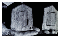
ib 06 バサング - ふたつのものすべての中に - メラ・ヤルスマ + ニンディティヨ・アルディブルノモ

伊吹島には出産前後を女性だけで集団生活し、家事から解放され養生する風習があり、その場所を出部屋（でべや）と呼んでいた。生命の誕生の場である出部屋の跡地に、作家は生命の樹を植える。