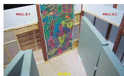
ib 04 壁 - エコ・ヌグロホ

「島の小さな集会所」となる庵を制作。建築素材には、イリコの加工に使うせいろや島の石垣、瓦、廃木材などを使用。