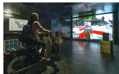
ib 02 伊吹島ドリフト伝説 - コンタクト・ゴンゾ

天井や壁のスリットから光が射し込み、その光が屋内につくり出す影は、あたかも迷路のように入り組む島の路地を連想させる。