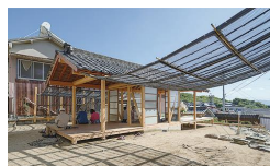
ib 03 イリコ庵 - みかんぐみ + 明治大学学生

伊吹島独特の細い路地や地形をもとにしたレーシングゲーム。原付バイクにまたがり路地を探検し、8分以内に島内を一周するとクリア。