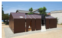
ib 01 トイレの家 - 石井大五

天井や壁のスリットから光が射し込み、その光が屋内につくり出す影は、あたかも迷路のように入り組む島の路地を連想させる。