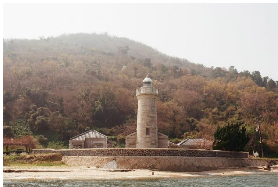
ロケ地として使用された男木島灯台

旅行企画実施 | 香川知事登録旅行業 第2-194号 琴平バス株式会社 コトバスセールス&ツアーズ