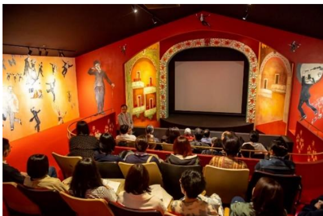
依田洋一朗「ISLAND THEATRE MEGI『女木島名画座』」

1932年、新婚夫婦の四郎ときよ子が観音崎の灯台に赴任してきた。やがてふたりは北海道石狩へ転任して二子をもうけ、その後も全国各地の灯台を渡り歩いていく。喧嘩することも多々あった。太平洋戦争では多くの仲間を亡くした。そして戦後は、成長した子供たちにも悲劇が……。しかし、それでも夫婦はともに力を合わせ、健気に生きていく。