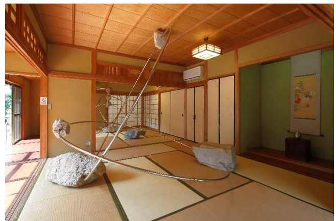
アリシア・クヴァーデ「レボリューション」