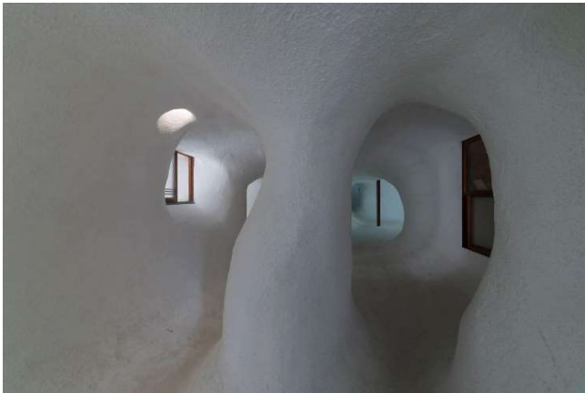
目「迷路のまち～変幻自在の路地空間～」